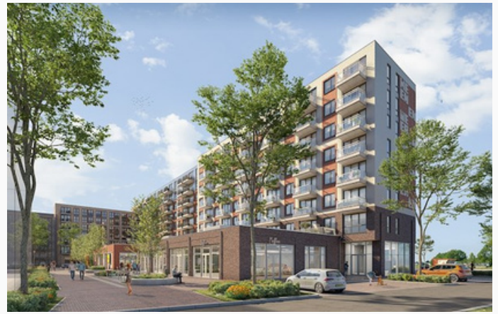
Art de impression van de koploper, met direct vooraan de ruimte voor een maatschappelijke organisatie.

Op dit moment vindt onderzoek plaats naar de financiële haalbaarheid en mogelijke huur/exploitatieconcepten voor deze ruimte. Met dank aan Architect | Interieurarchitect Phylcia Ramdhan -Kok-Sey- Tjong van LUX.Architectuur hebben we in de week van 24 mei een aantal schetsen en concepten bij de wethouders kunnen presenteren.