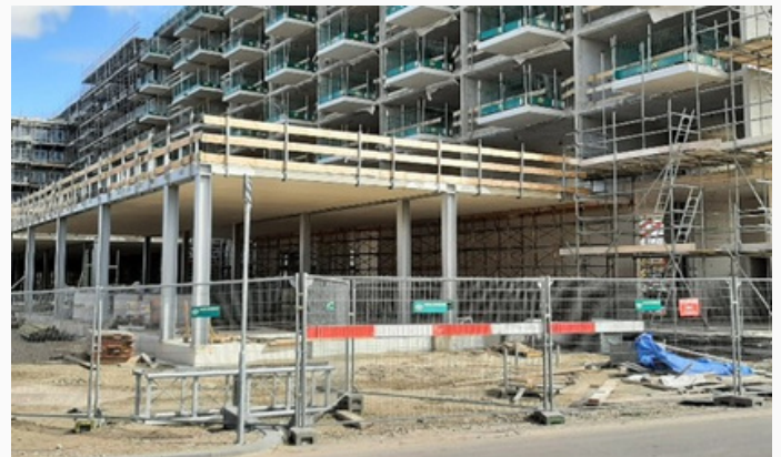
Huidige status van de bouw, medio mei 2022, met vooraan het aanzicht op de mogelijke ontmoetingsruimte.